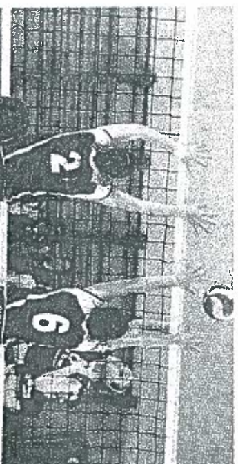
La Brenta Volley è stata fondata nel 1991 a Tione

zio giudicariese – nel complesso la nostra società riesce a portare in palestra circa 200 tesserati fra ragazze e ragazzi, un lavoro importante che cerchiamo di portare avanti su tutto il territorio». Da diversi anni la società, infatti, non punta solamente ad una prima squadra ed anzi ha fatto del lavoro sul settore giovanile una propria priorità. Le prime squadre, militanti in Prima divisione femminile ed appunto serie D femminile, sono costantemente rifornite di giovani e giovanissime uscite dal settore giovanile. Con accanto il Team Volley C8 ed il Castel Stenico l'attività del Brenta