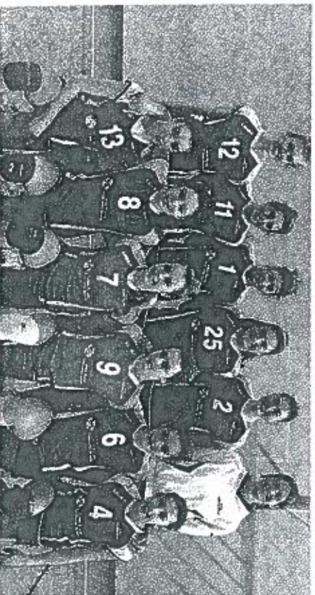
La formazione del Brenta Volley: la squadra è giovanissima ma promette molto bene