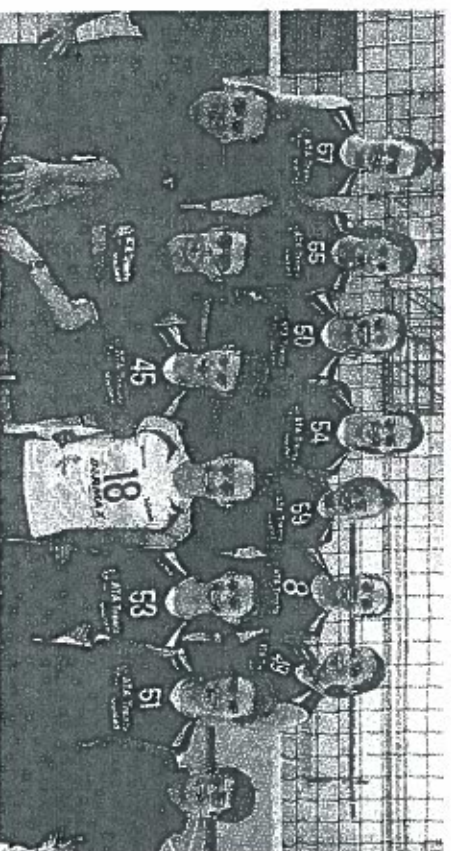
La formazione dell'Ata che ha dominato dall'inizio alla fine