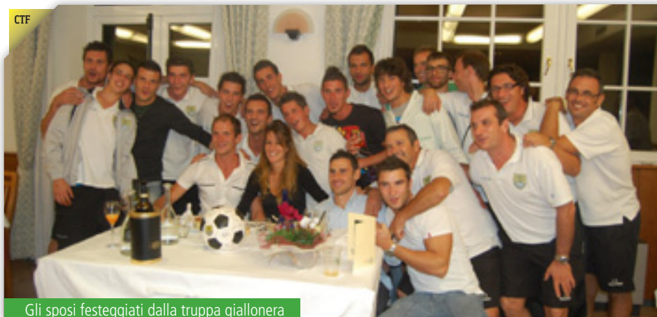
Gli sposi festeggiati dalla truppa giallonera